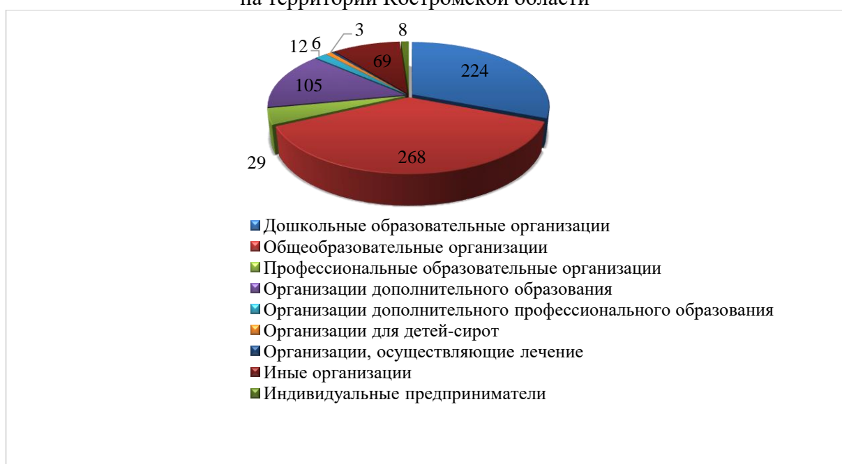
Типы организаций, осуществляющих образовательную деятельность на территории Костромской области